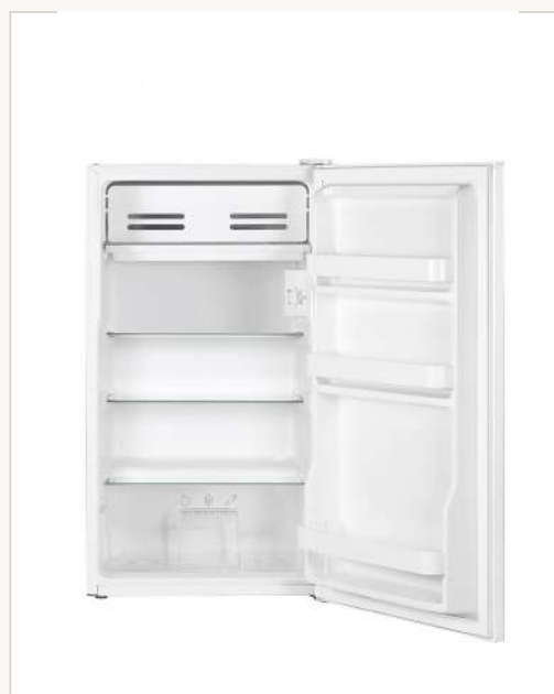
Interior con estantes regulables y cajón inferior.

Datos conforme a la especificación de producto del fabricante. Las imágenes son orientativas y pueden no reflejar el color o acabado final.