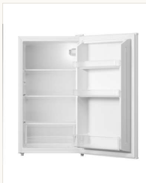
Interior con estantes regulables y cajón inferior.

Datos conforme a la especificación de producto del fabricante. Las imágenes son orientativas y pueden no reflejar el color o acabado final.